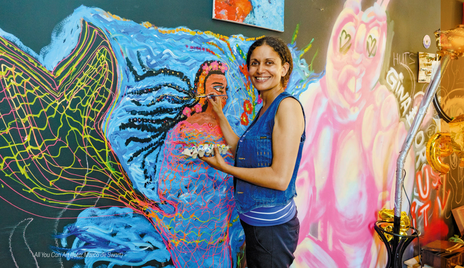
All You Can Art

raking met de kunstenaars van AYCA. Ook zijn er talrijke ontmoetingen op de locaties in de wijken, bij partnerinstellingen, bij ondernemers in de wijken en op straat. Door de diversiteit aan evenementen en locaties trekt het project een breed en divers publiek.